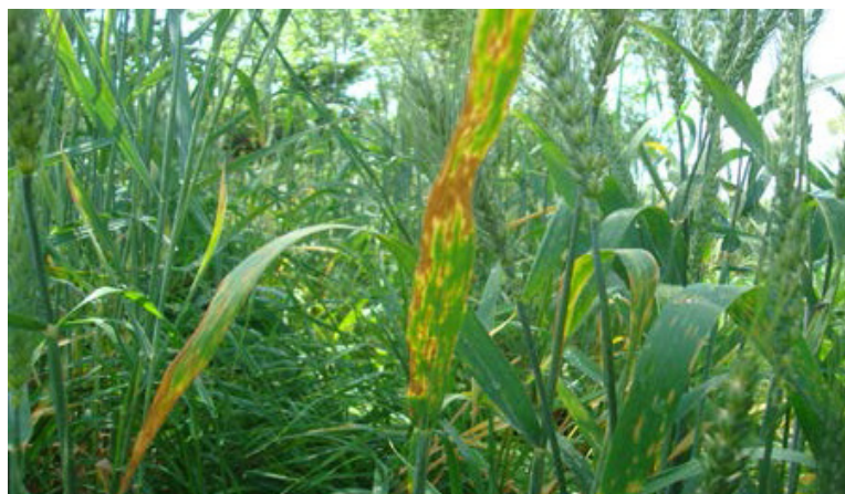
Figura 2. Lesiones necróticas sobre las áreas cloróticas producidas por Z. tritici en hoja bandera de Triticum aestivum .