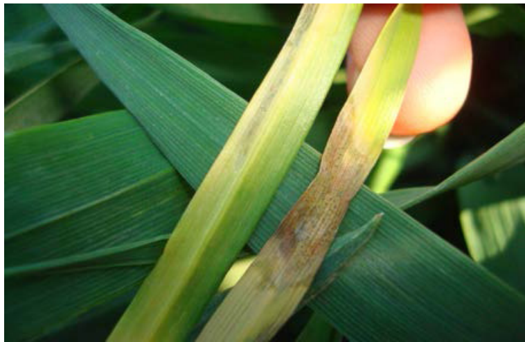
Figura 1. Lesiones necróticas con picnidios (puntos negros) producidos por Z. tritici en las hojas inferiores de Triticum aestivum .

Los síntomas se manifiestan al principio como puntos cloróticos en las hojas inferiores, más frecuentemente en las hojas basales próximas al inóculo del suelo, pudiendo aparecer los síntomas en cualquier estado de crecimiento de cultivo (Fig. 1 y 2).