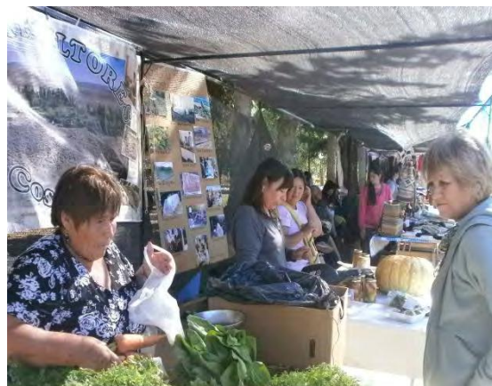
FIGURA 4. Feria de Ferias, Gualjaina 2015.

Los desafíos son muchos, en relación a los productos: uno de ellos es poder diseñar en forma consensuada un logo que identifique a la red, otro es elaborar un reglamento de funcionamiento, su estatuto y personería jurídica, su registro, entre otras tantos procesos a construir.