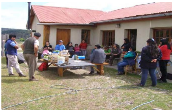
FIGURA 1. Feria: Encuentro de un mercado de la red en Lago Rosario.