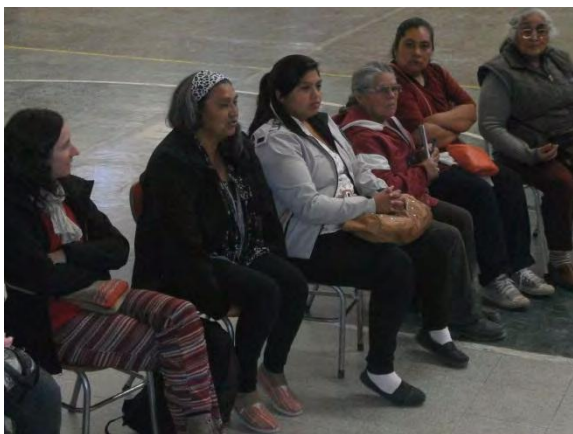
FIGURA 3. Encuentro de evaluación de la red, Gualjaina 2015.

El proceso de organización de la red conllevó a encuentros de evaluación y cierre de la temporada (figura 3), con la participación de todos los nodos, con diferentes dinámicas en cada uno de ellos; la realización de una feria de ferias en el 2012 en Trevelin y una feria de ferias en el año 2015 en Gualjaina (figura 4), con la participación de mucha población local, dada la relevancia del evento.