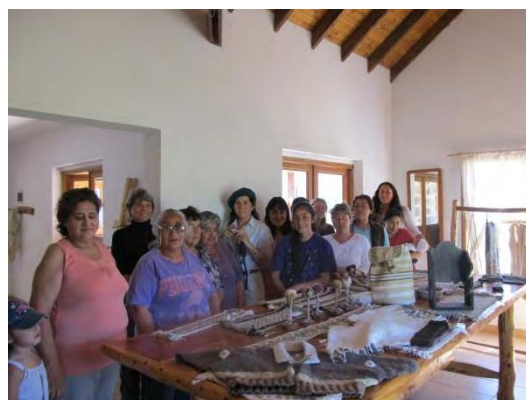
FIGURA 2. Encuentro de Capacitación del grupo de Feria de Los Cipreses.

La tabla 1 refleja a modo de ejemplo el estado de algunos nodos de la red de ferias y mercados a la presente temporada 2014/2015, mostrando los diferentes procesos en los que se encuentran los nodos