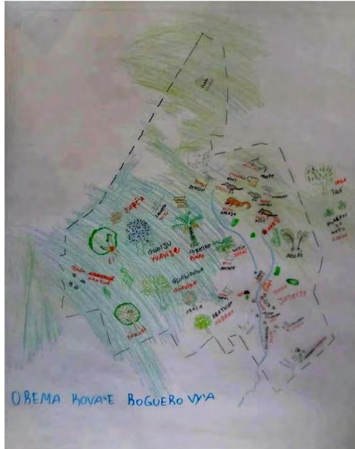
FIGURA 3: Primeiro mapa “aquilo que deixa o Mbyá feliz” (Orema kova'e roguero vy'a), são expostas as espécies da fauna e da flora nativa, a presença de roças com cultivos tradicionais, entre outros.