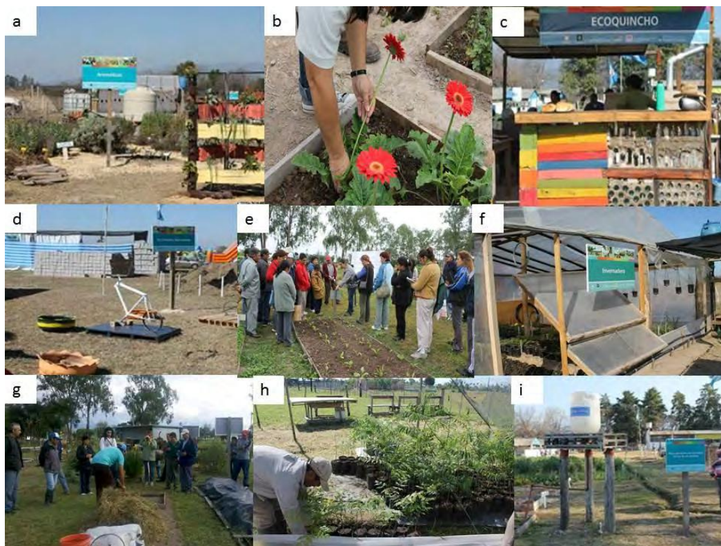
FIGURA 2. Módulos del CDA Rosario de Lerma: a) Jardín de Aromáticas, b) Floricultura, c) Ecoquincho, d) Parque de Herramientas Apropiadas, e) Huerta Intensiva, f) Invernadero, g) Lombricultura, h) Forestales, i) Riego por goteo gravitacional.

capacitaciones, además surgió un grupo de emprendedores que fueron organizados en un proyecto PROFEDER 1 INTA, y parte de ellos ya participaron con sus productos tanto de la Expo Granja 2014 como de la I Feria de Emprendedores de Rosario de Lerma 2014.