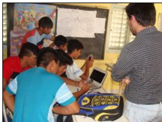
Figura 13. Actividades realizadas en el aula.

Como se muestra en la figura 13, los alumnos contestaron los cuestionarios en un ambiente ameno y distendido, interactuando permanentemente entre sí y también con la coordinadora. En algunos casos repitieron cuestionarios para superar sus puntajes y acomodarse mejor en la tabla de posiciones.