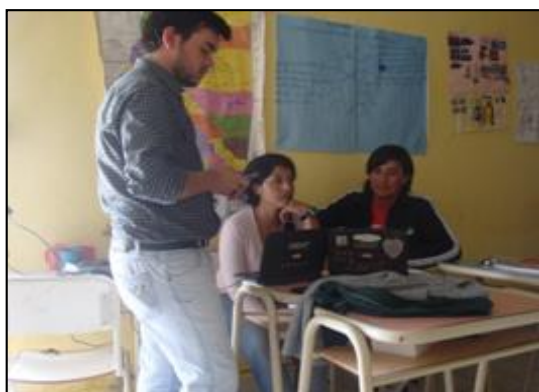
Figura 11. Capacitación realizada previa a la experiencia.

En primera instancia, los alumnos fueron instruidos con conocimientos necesarios para el despliegue de una red móvil, más precisamente con el tema de redes y telecomunicaciones (Figura 11).