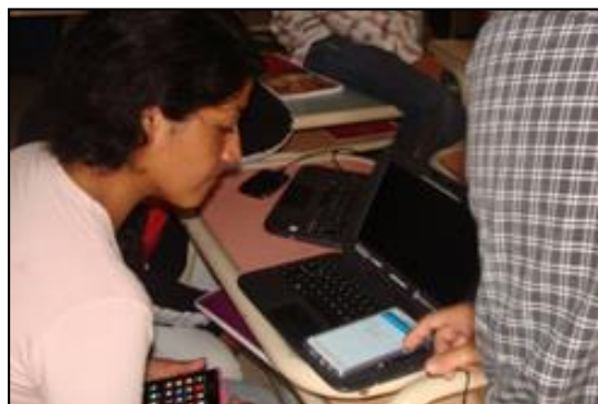
Figura 12. Ejecución de la aplicación en el celular de una alumna.

por la coordinadora sobre temas elegidos para la clase de ese día.