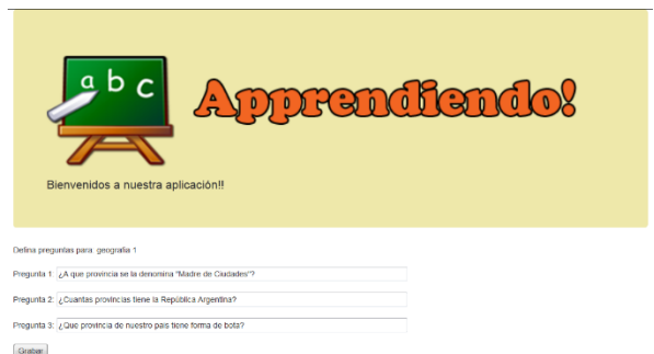
Figura 9. “Apprendiendo”, creación de un cuestionario

En la figura 8 se observa el entorno interactivo en la modalidad docente, con las opciones para crear y administrar cuestionarios. A modo de ejemplo, en la figura 9 se muestra la creación de un cuestionario.