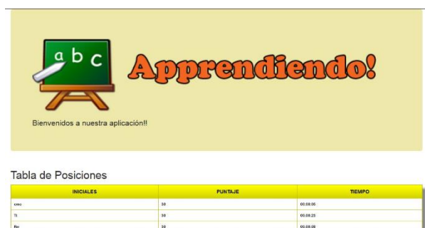
Figura 10. Resultados del cuestionario

Una vez que los alumnos completan los cuestionarios, el docente puede consultar la tabla de posiciones (Figura 10), para evaluar el nivel de conocimientos que tiene cada alumno sobre el tema del cuestionario.