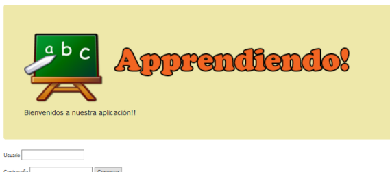
Figura 7. “Apprendiendo”, login de usuario

Una vez finalizada la configuración del escenario de trabajo, se procedió a instalar en los celulares la aplicación “Apprendiendo”. Se trata de una aplicación desarrollada por los autores de este trabajo que presenta similitudes con el popular juego “Preguntados”, aunque a diferencia de “Preguntados”, “Apprendiendo” solo maneja contenidos de índole educativa. Permite al docente crear cuestionarios sobre un tema específico, los cuales el alumno debe responder siguiendo la modalidad de preguntas de opción múltiple (“multiple choice”). La aplicación está diseñada para ejecutarse en entornos con limitaciones de ancho de banda y energía, por lo cual es bastante sencilla y liviana y el tráfico que se genera entre el nodo cliente y el servidor es muy reducido. Existen dos tipos de usuarios, uno corresponde al diseñador del cuestionario (identificado como el profesor) y otro al jugador (identificado como el alumno).