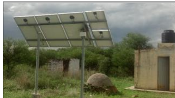
Figura 4. Panel solar fotovoltaico utilizado en el establecimiento educativo “86044”.

Estos agrupamientos, como así se los llama, disponen para la dirección de una coordinadora, quien establece el nexo entre todas estas instituciones; profesores tutores por