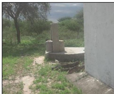
Figura 3. Aljibe utilizado en el establecimiento educativo “86044”.

Los alumnos del agrupamiento conforman dos niveles de aprendizaje, un nivel inicial y un nivel superior. El nivel inicial corresponde al primer y segundo año de la secundaria, mientras que los restantes del tercer al quinto son del ciclo superior.