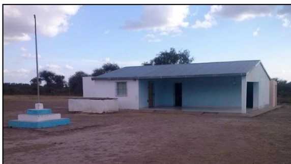
Figura 1. Establecimiento educativo “86044”