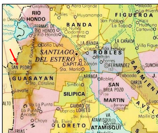
Figura 2. Ubicación geográfica del establecimiento educativo “86044”

cada agrupamiento, quienes gestionan más de cerca los mismos; y profesores que se encargan del dictado de clases.