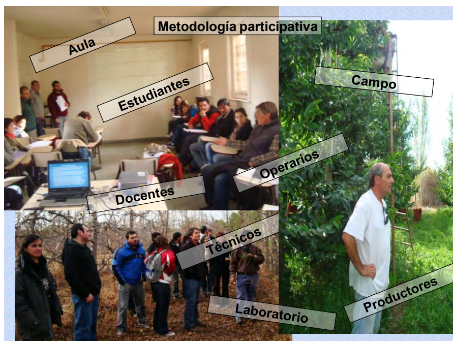
FIGURA 1. Metodología participativa. Presentaciones orales grupales con el conjunto de estudiantes cursantes, docentes de la cátedra y docentes invitados, productores, operarios y técnicos de cada Unidad Productiva. Visitas a las distintas UP's ubicadas en la Región del Alto Valle, Patagonia, Argentina.

De la encuesta final individual y escrita completada por todos los estudiantes al finalizar el cursado, durante los tres años de trabajo se pudo observar que el 87% de los estudiantes encuestados en los años 2010, 2011 y 2012 opinaron que los objetivos enunciados en los trabajos prácticos se cumplieron y el 88% consideró interesante la metodología utilizada (figura 2). Un 95% piensa que esta metodología participativa le generó nuevos interrogantes y el 89% cree que los trabajos prácticos le aportaron herramientas para comprender los conceptos de la materia. Finalmente el 67% de los estudiantes encuestados en el espacio temporal planteado, opina que la Agroecología como disciplina, le permitió visualizar la solución de problemas en el sistema productivo desde la multidimensión del pensamiento y el análisis holístico del agroecosistema aunque el 29% pudo llegar a esta conclusión sólo parcialmente.