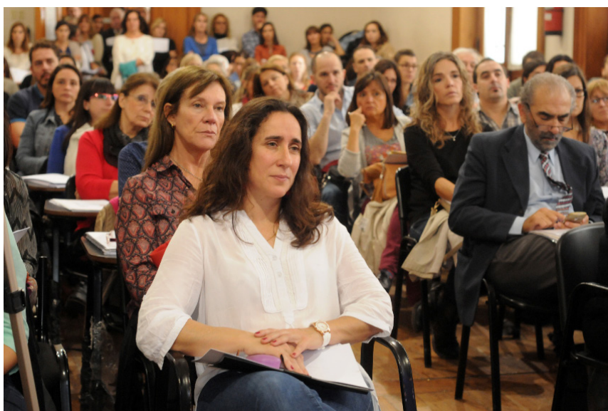
Docentes de la UNLP y de otras universidades nacionales del país, como así también de países limítrofes compartieron sus reflexiones sobre las prácticas docente en la Universidad.

También es importante estar atento a ser respetuoso de la heterogeneidad de las prácticas en función de las particularidades institucionales y no buscar la homogeneización pedagógica de las mismas y por último el reconocimiento y valorización de que hoy en nuestra aulas tenemos estudiantes que en otro momento fueron el objeto de estudio de la ciencias humanas y sociales que tensionan a la académica con nuevas estéticas y nos interpelan en las aulas, en las clases, a la docencia como función pública y fundamentalmente a nuestra experiencia, no solo la vivida sino la que hacemos vivir a nuestros estudiantes.