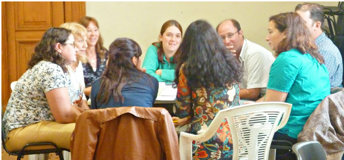
Planteadas como espacio de reflexión acerca de los desafíos que las transformaciones actuales suponen para las prácticas docentes universitarias las jornadas buscaron promover la puesta en común y el intercambio.

allá de lo expositivo, proponiendo espacios de discusión e intercambio que se enriquecieron con los debates en torno a la docencia universitaria. De este modo, se puso en juego el ejercicio de pensar la docencia en su contexto.