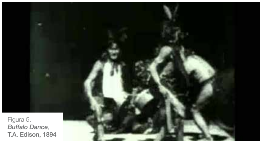
Figura 5. Buffalo Dance , T.A. Edison, 1894

y no me agrada» (Griffiths, 2003: 200). Sabiendo que se trata de una actuación donde se ha establecido una relación comercial con su imagen y suponiendo que, al menos en el ámbito nacional, se trataba de figuras extremadamente reconocidas y famosas por el espectáculo del que formaban parte, nos parece que en realidad esa mirada percibida como amenazante tranquilamente se asume como formando parte de la puesta en escena buscada (el propio Buffalo Bill los hacía interpretar roles amenazantes, violentos, malvados –aunque también montara números donde se podría apreciar una cara más amable de ellos en cuanto a sus costumbres familiares y formas de vida–). Asimismo la connotación de la mirada como amenazante resulta un tanto ambigua y podría simplemente ser la respuesta a un llamado o indicación por parte del camarógrafo o alguien cerca de él hacia los bailarines [Figura 5].