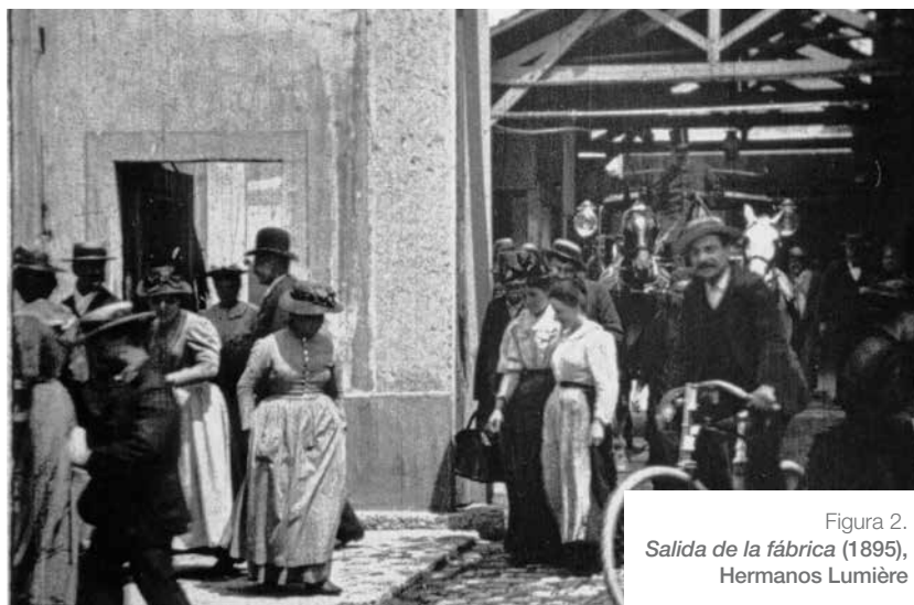
Figura 2. Salida de la fábrica (1895), Hermanos Lumière

En el caso de los Lumière, André Labarthe señalaba en su análisis sobre la Salida de la fábrica (1895) como se trataba, ya en esta película inicial del arte cinematográfico y sus múltiples versiones, de una imagen controlada, imagen bajo control: control del espacio, del tiempo y del movimiento de los cuerpos, que la irrupción de lo azaroso no alcanzaba incluso a desestabilizar [Figura 2].