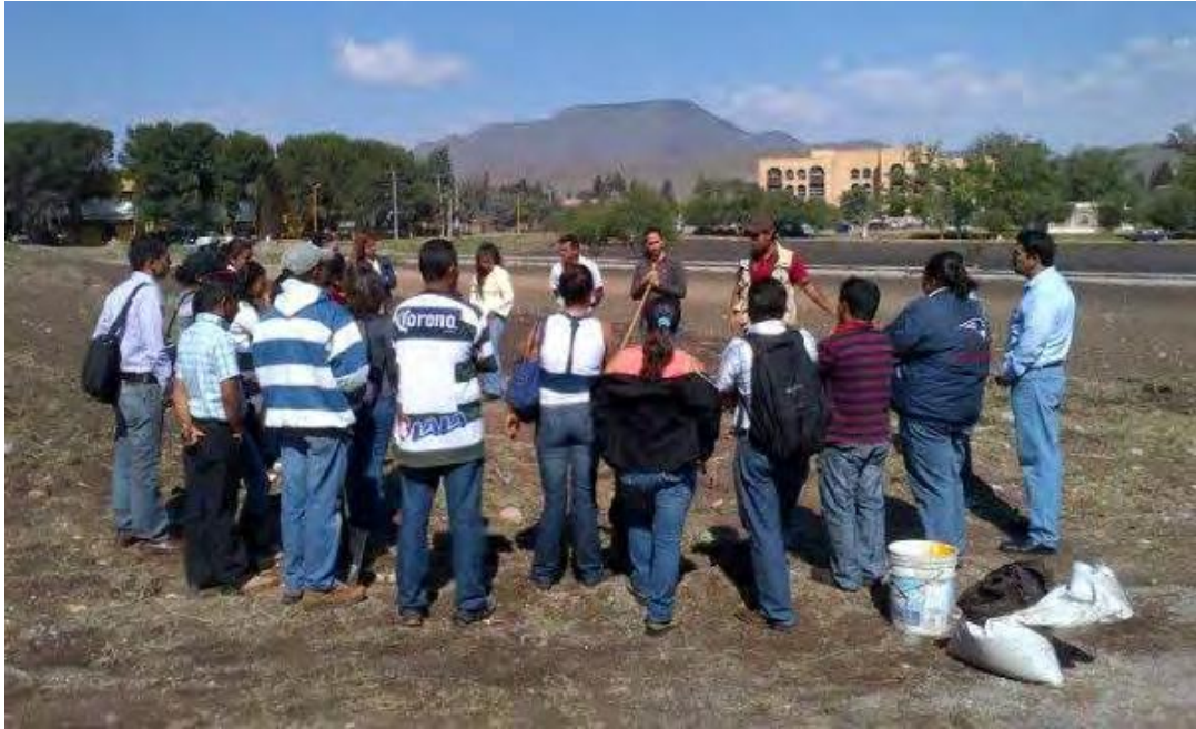
FIGURA 2. Taller de camas biointensivas 2013.

Bajo la construcción de alianzas con otros actores de la Sociedad Civil, se han hecho alianzas con Casa Verde A.C., Actúa Verde A.C., la Fundación Yuye Martínez A.C. para promover cursos de introducción a la permacultura, camas biointensivas, huertos verticales y educación ambiental alimentaria. Este último a escuelas de diferentes niveles educativos, para motivar a los estudiantes y futuros ciudadanos en adoptar hábitos alimenticios sustentables y el consumo responsable.