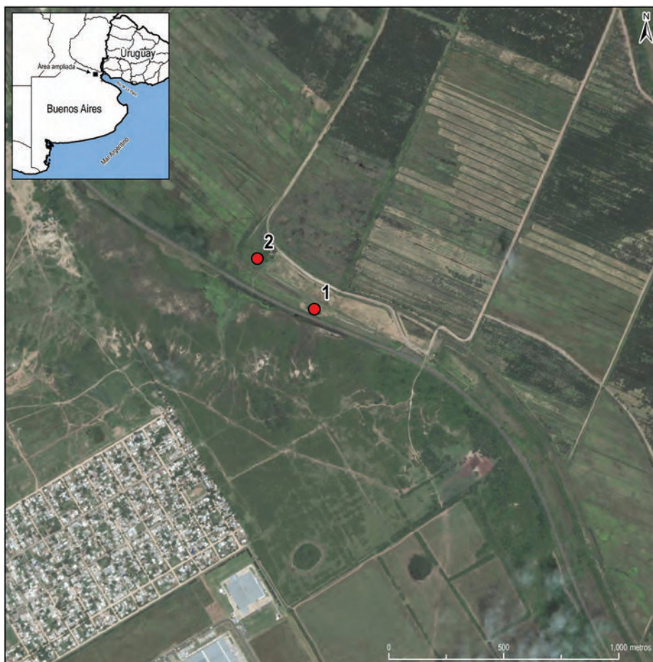
Figura 1. Distintas ubicaciones del Túmulo de Campana (modificado de Politis y Bonomo 2015: figura 2 sobre la base de la figura 4 de Lafon 1971). En el trabajo original Lafon señaló 1 y 2 en la foto con flechas y en el epígrafe solo indicó “Yacimiento arqueológico Túmulo de Campana” sin más especificaciones. Según Orquera, Lafon excavó el sitio 1 y ubicó al Túmulo de Campana excavado por Zeballos y Pico con el número 2. Según Loponte y Acosta (2015) el Túmulo de Campana (TCS1) es donde está el n° 1 y la excavación de Lafon donde está el n° 2 (TCS2).

Hay otros puntos adicionales ya referidos en nuestro trabajo que fueron omitidos por Loponte y Acosta (2015). Para Orquera, quien acompañó a Lafon en los trabajos de campo de la década de 1960 durante los cuales se excavó el lugar, el Túmulo se encontraba en una ubicación distinta a la que ahora señalan Loponte y Acosta (figura 1). Orquera refuerza lo expresado en Politis y Bonomo (2015:158) y reitera, en los comentarios al final de este artículo, que la excavación de Lafon (figura 1) estaba localizada en donde ahora Loponte y Acosta ubican el Túmulo de Campana, o sea entre 250 y 300 m de distancia. Es decir, para Orquera, Loponte y Acosta (2015) invierten la ubicación entre los dos sitios, confundiendo el lugar sondeado por Lafon con aquel donde este autor ubicó al Túmulo de Campana de Zeballos y Pico (véanse los comentarios de Orquera al final de este artículo).