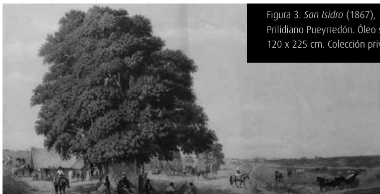
Figura 3. San Isidro (1867), Prilidiano Pueyrredón. Óleo sobre tela, 120 x 225 cm. Colección privada

Según apreciamos, existe cierta forma de construir el thopos rural en estas obras, el cual se evidencia con similares características en cada una de ellas y con la repetición en las posturas, en los gestos, en la ubicación y en las vestimentas de los personajes. Si bien no resultan exactamente iguales, cabe destacar la presencia recurrente del ombú sobre el cual los personajes descansan, ya sea de un largo viaje ( Un alto en el campo ) o bien de una ajetrejada jornada ( San Isidro ).