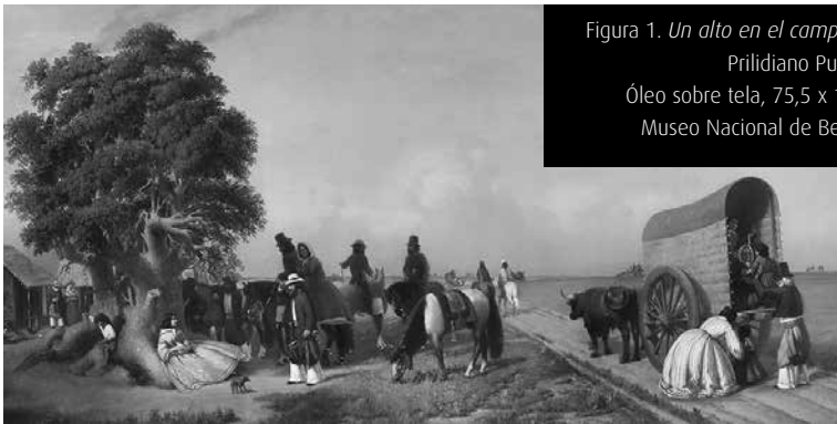
Figura 1. Un alto en el campo (1861), Prilidiano Pueyrredón. Óleo sobre tela, 75,5 x 166,5 cm. Museo Nacional de Bellas Artes

Dentro de este maridaje, nos preguntamos acerca del papel que desempeñaron las escenas costumbristas de Pueyrredón. Según postulamos a modo de hipótesis, ellas encarnan el dilema sarmientino, como un termómetro de un derrotero muy particular: la edificación estatal argentina sobre un proceso civilizatorio de la barbarie rural. Abordaremos las producciones de Pueyrredón no como un factor hegemónico y determinante de una época, sino como impresiones que cobijaron ideas y concepciones sobre el civilizado ordenamiento que se estaba gestando. En este sentido, seleccionamos tres obras costumbristas para realizar un análisis indiciario: Un alto en el campo (1861) [Figura 1]; Un domingo en los suburbios de San Isidro (1864) [Figura 2] y San Isidro (1867) [Figura 3].