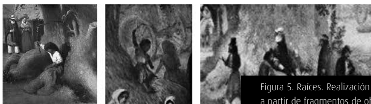
Figura 5. Raíces. Realización propia a partir de fragmentos de obra

Si bien no esperamos encontrar eucaliptus en las obras de Pueyrredón, nuestras preguntas abrevan, precisamente, en esta modificación del ombú como característica de la pampa húmeda. Si el ombú era inútil o peligroso por representar la barbarie , quizás sus raíces hundidas en el territorio pampeano aludan simbólicamente a la herencia cultural de una sociedad que resiste en silencio ante las profundas transformaciones. Incluso esas mismas raíces se ven trocadas en las obras de Pueyrredón: aquellas que otrora sirvieron de montura para el infante en Un alto en el campo (1861) y en Un domingo en los suburbios de San Isidro (1864), en San Isidro (1867) dejarán de cumplir tal función y se limitarán a ser espacio de descanso, de sociabilidad del campesinado y sitio acogedor para un asado [Figura 5].