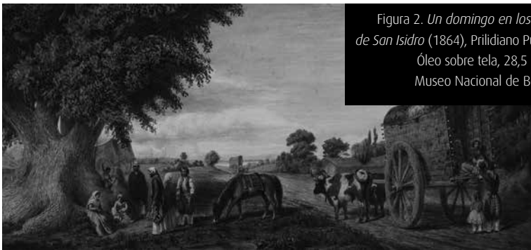
Figura 2. Un domingo en los suburbios de San Isidro (1864), Prilidiano Pueyrredón. Óleo sobre tela, 28,5 x 59,5 cm. Museo Nacional de Bellas Artes