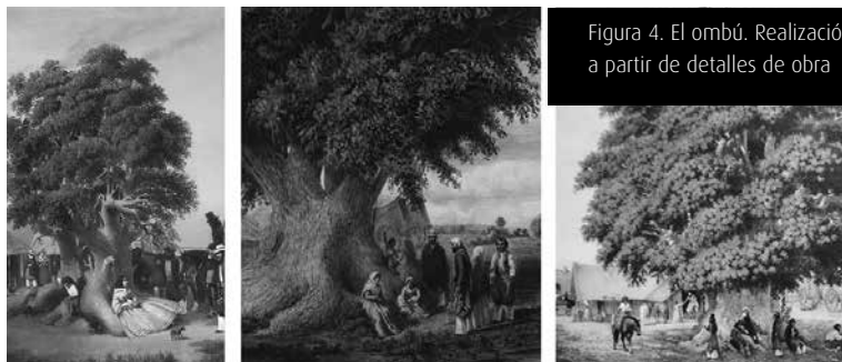
Figura 4. El ombú. Realización propia a partir de detalles de obra

Dentro de este complejo tapiz, quisiéramos detenernos en un elemento: el ombú como metáfora naturalista. En las obras seleccionadas se observa un persistente aumento en las dimensiones del ombú, que pasa de ser una figura cuasi accesoria a dominar la composición y las figuras humanas que ella contiene [Figura 4].