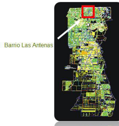
Barrio Las Antenas

El barrio de Las Antenas también se localiza en el partido de La Matanza. Posee unas 7 hectáreas de terreno en las que viven actualmente 9.000 habitantes. El barrio comenzó a formarse en 1950 aproximadamente. Según nos comentaron los coordinadores de la Unidad Ejecutora de Villas de La Matanza, surge como un asentamiento precario y desordenado en terrenos ganados al predio de la radio “Las Antenas” que funcionaba en el lugar (Figura 2)