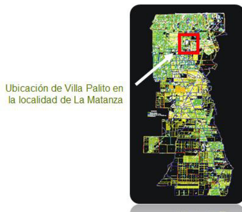
Ubicación de Villa Palito en la localidad de La Matanza

A su alrededor se encuentran los barrios: Tablada, San Justo (Villa Constructora) y Ciudad Evita (Figura 1)