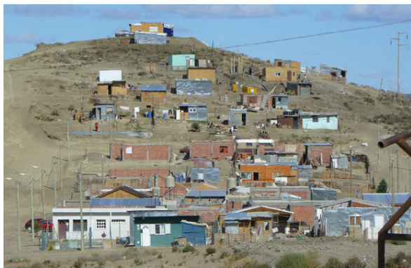
Figura 2. Asentamiento Zona Sur

la buena accesibilidad y un buen emplazamiento. Paradójicamente, el estado provincial financia/subsidia el acceso a la vivienda a los sectores que mayor renta obtienen en el circuito petrolero 13 . De esta forma se han entregado tres conjuntos habitacionales: Barrio Petroleros Privados de 32, 634 y 113 viviendas.