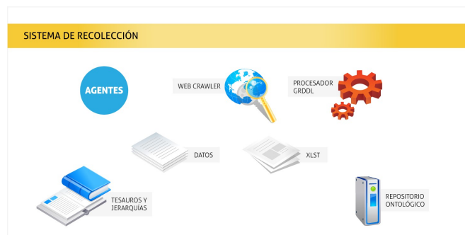
Fig. 1: Sistema de Recolección

La plataforma que aquí se presenta, cuyos componentes se detallan a lo largo de esta sección, se divide en dos grandes sistemas: sistema de recolección y sistema de búsqueda (Fig. 1 y 2). El sistema de recolección tiene como objetivo analizar las paginas web almacenadas en una base de datos y detectar aquellas que están marcadas, extraer su contenido y almacenarlo en una ontología previamente definida para una temática dada, seleccionando términos de un tesauro. El sistema de búsqueda es el encargado de guiar al usuario a realizar una búsqueda inteligente sobre un repositorio que ha sido poblado por el sistema de recolección.