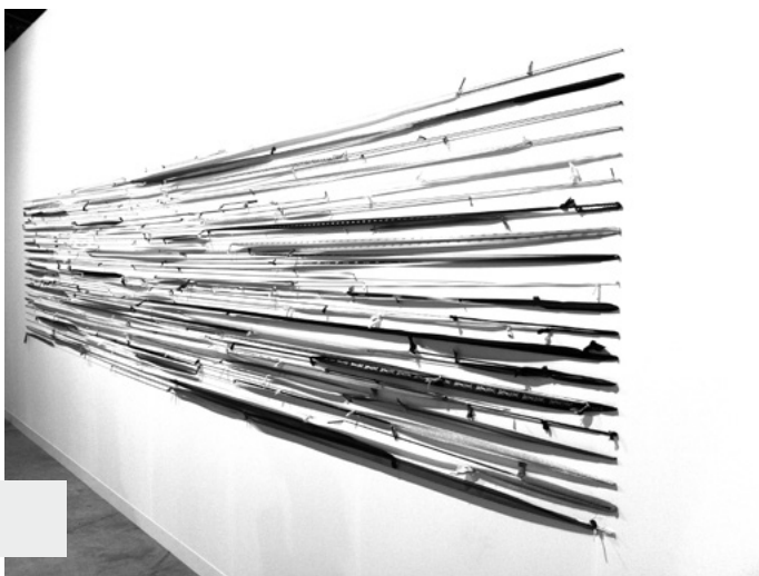
Figura 3. Knotted Km (2004), Jac Leirner (Brasil)

¿Qué pasaría si despojados de todo prejuicio, de todo artilugio teórico-crítico colonizador, miramos las obras de los actuales artistas textiles latinoamericanos? ¿Podríamos arriesgar que en ellas aparecen rescatadas, renovadas, reinterpretadas –luego de discontinuidades que las volvieron invisibles–, esas formas supervivientes que permanecen tercamente y pese a todo? Nudos, tramas, urdimbres entre el presente y ese pasado que se resiste a perecer y a limitarse a ser sólo un objeto de estudio de las ciencias naturales. ¿No estaríamos en condiciones de reconocer una gran cantidad de artistas que aún no frecuentamos porque continúan bajo la denominación de «artesanos» en sus países de origen, sobre todo, las productoras mujeres?