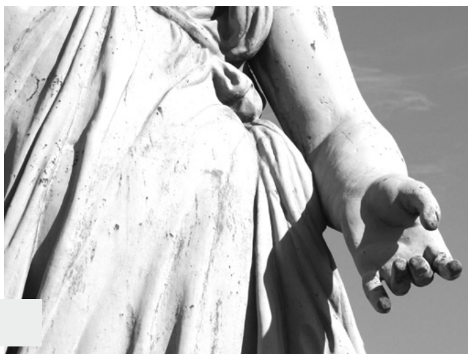
Figura 2. Las Cuatro Estaciones, La Plata