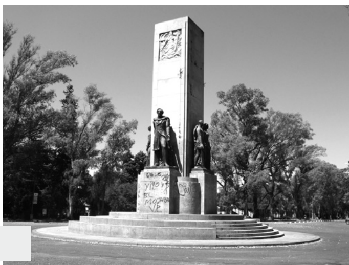
Figura 3. Monumento a Bartolomé Mitre, La Plata