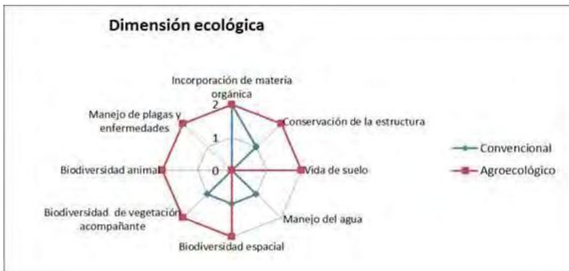
FIGURA 1. Diagrama AMEBA que representa los indicadores de la dimensión ecológica para dos sistemas productivos en San Carlos, Mendoza.