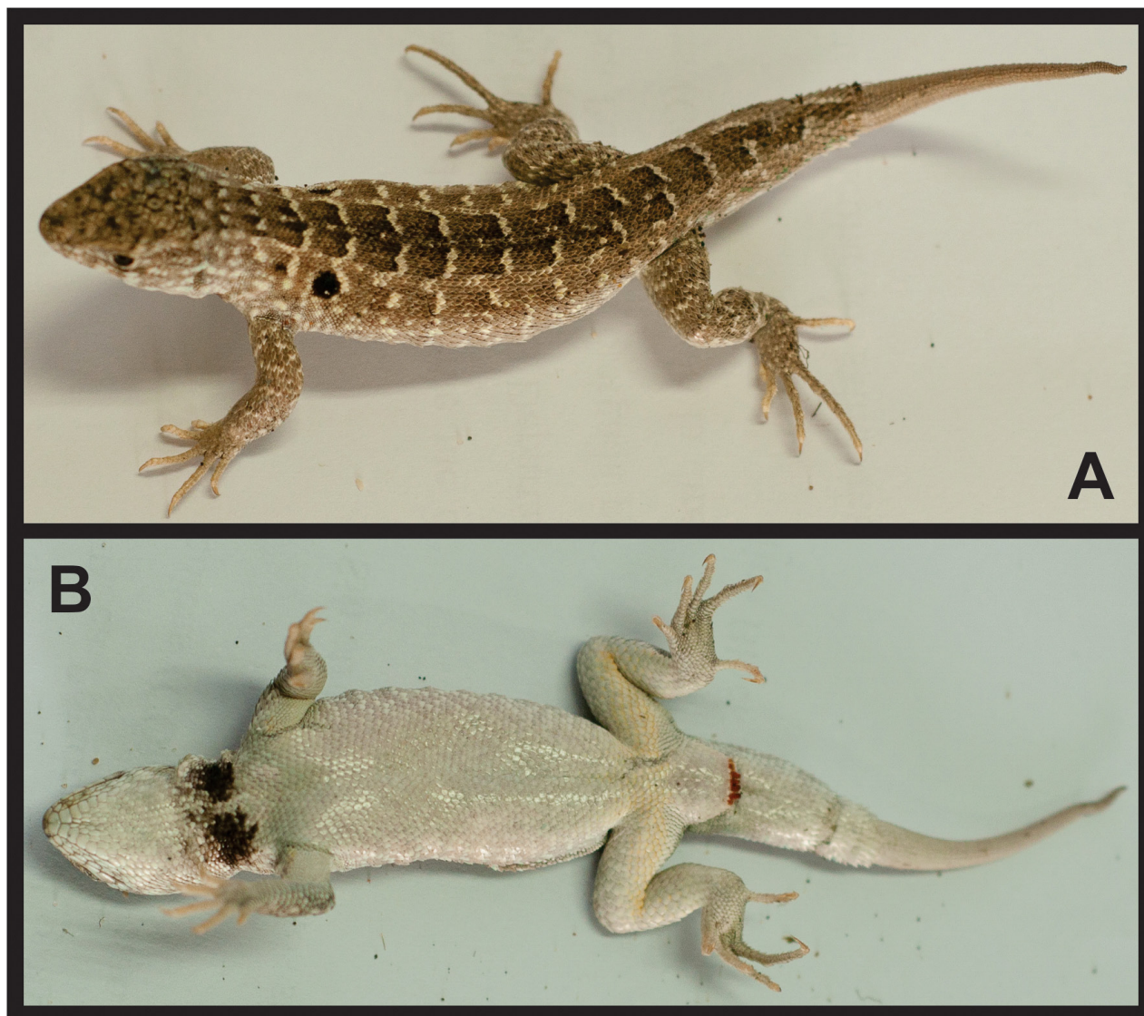
Figura 2. Vista dorsal (A) y ventral (B) del macho adulto de Liolaemus martorii colectado en la Villa Balnearia 7 de Marzo, provincia de Buenos Aires.

Provincia fitogeográfica del Monte caracterizado por estepas gramíneas y arbustivas sobre un sustento de dunas vivas y semi-fijas de baja altura, con escasa cobertura vegetal (Cabrera 1971). El clima de la región es templado semi-árido, con alta erosión eólica y escasa retención de humedad. Este nuevo registro constituye el primero de L. martorii para la provincia de Buenos Aires y amplía su rango de distribución 35 km al noreste del punto más cercano conocido (La Lobería, Río Negro, Argentina; Fig. 1). Cabe destacar la importancia de este reporte, dado que el individuo de L. martorii fue hallado en la margen norte de la barrera zoogeográfica que constituye el río Negro, en el último balneario del litoral marítimo bonaerense. En la actualidad, el hábitat de esta especie en la provincia de Río Negro se encuentra muy deteriorado por la circulación de vehículos en