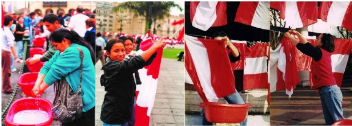
Lava la bandera. 2000

Esta obra tiene características ligadas a la performance ya que está concebida como una acción que puede repetirse de modos similares y siempre propone el mismo objetivo aunque haya variables que la vayan modificando. Es eminentemente participativa y colaborativa. Utiliza mínimos recursos materiales, pero logra un impacto visual sorprendente dado por la masividad.