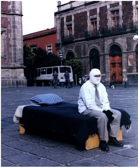
Mientras todos comen .2003

El entorno urbano es considerado el lugar donde las injusticias pueden hacerse visibles. La obra no ocupa grandes zonas, pero se aleja de las edificaciones generando un vacío a su alrededor. El artista se muestra en soledad buscando provocar la atención de los espectadores que podrían acercarse a él, pues nada ofrece un límite, solamente la incomodidad que impone su actitud silenciosa y pasiva.