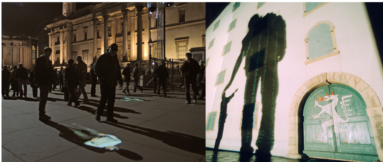
Under Scan y Re:Posición del Miedo. 1997

Por otra parte, la participación directa del espectador subraya el concepto de escala. La silueta del transeúnte logra, por un momento, tocar el techo, llegar al cielo, encontrarse con el otro en un juego de “dominación consensuada” producto de la diferencia de escala entre ellos. El artista reflexiona en torno a esta operación a partir de la definición de telepresencia como amplificación de la participación del usuario a escala urbana. Telepresentarse a una escala fuera de la norma junto a otros vehiculiza la transformación del espacio artístico.