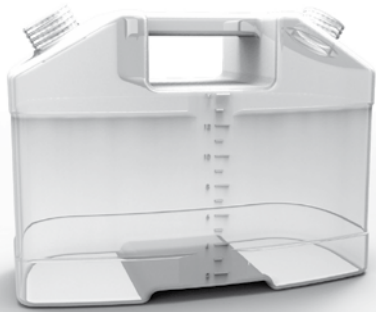
Bidón con medidor ▲