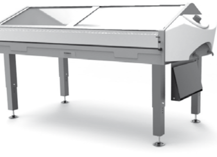
Perspectiva del conjunto destilador ▲