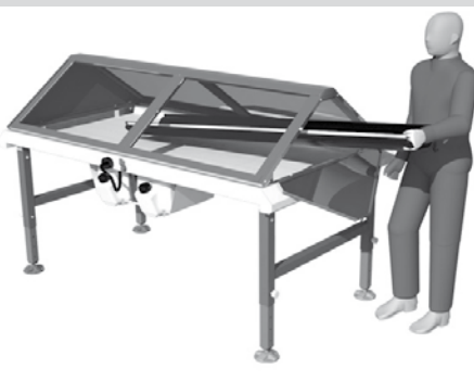
Extracción de lona ▲