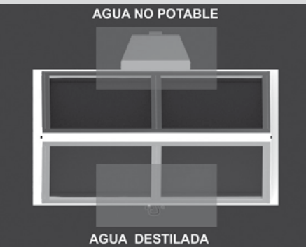
División de aéreas de agua potable y no potable ▲

Facultad de Bellas Artes. Universidad Nacional de La Plata. Argentina