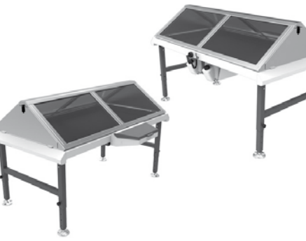
Destilador solar tipo caseta ▲