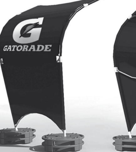
Velas publicitarias ▲