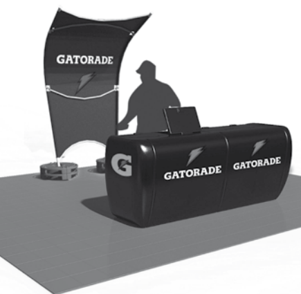
Puestos de hidratación ▲

ESTADIO GATORADE Laureano Alzamendi, Jesica Britos, Germán Urbaneja Tableros (N.º 7), pp. 52-53, octubre 2016. ISSN 2525-1589 http://papelcosido.fba.unlp.edu.ar/tableros Facultad de Bellas Artes. Universidad Nacional de La Plata