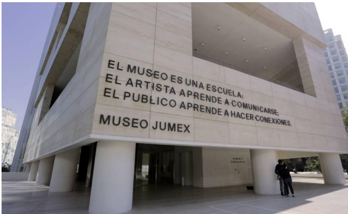
Figura 1: Vista de la obra en el Museo Jumex. Ciudad de México. Redistribución de roles; nuevos contratos para nuevos públicos.

Palabras clave: arte latinoamericano - conceptualismo – pedagogía - político-crítico