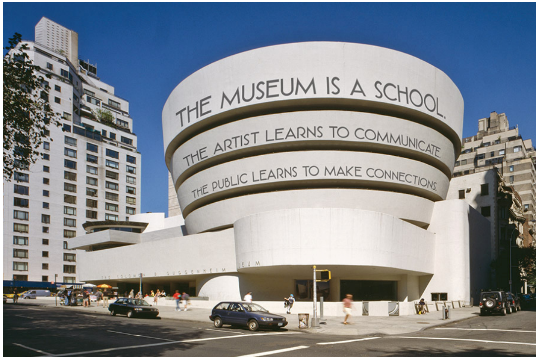
Figura 3: Vista de la obra en el Museo Guggenheim. Nueva York.