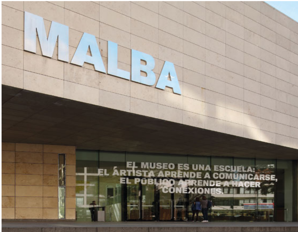
Figura 4: Vista de la obra en el Museo de Arte Latinoamericano. Buenos Aires

No se trata, por lo tanto, de una posición anti-institucional de denuncia, sino que -por el contrario-, yuxtapone los supuestos de dos instituciones desde sus propias lógicas para abrir intersticios que revisen los sistemas de categorías y las funciones preestablecidas. Su carnadura político-crítica radica por lo tanto en una redistribución de posiciones y roles sociales, que ingresan en una dinámica comunitaria en la que antes no participaban.