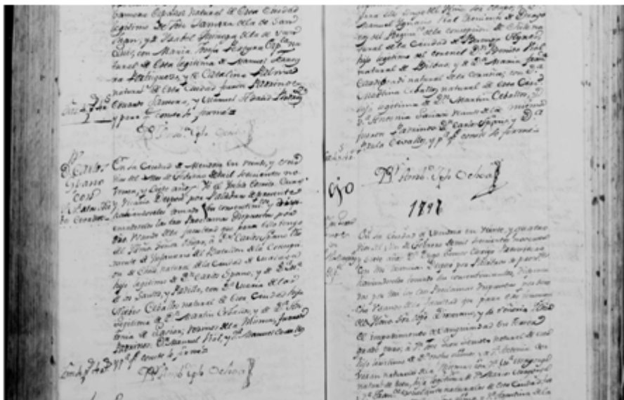
Argentina, Mendoza, Registros parroquiales, 1665-1975. San Nicolás de Tolentino, Matrimonios 1775-1814, Imagen 325.