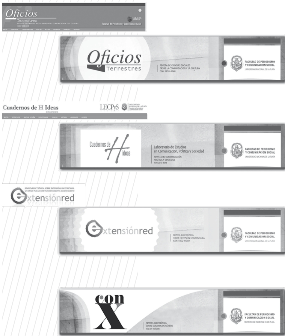
Figura 1. Marcas y encabezados originales y posteriores al rediseño visual y editorial