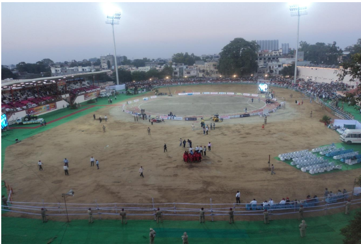
Estadio y cancha de Kabaddi , nótese la demarcación explicada en el párrafo anterior.

La cancha de Circle Kabaddi cuenta con una superficie de tierra y arenisca de 44 metros de diámetro, una línea central divide el campo en dos mitades iguales de 22 metros cada una, sobre la mitad de esta línea central se encuentra la “pala”: una puerta o entrada que mide seis metros desde sus extremos, donde se hallan dos montículos de tierra coloreadas que indican los límites. Sobre uno de los costados de la cancha se observaban dos líneas demarcatorias en diagonal (dándole a la cancha una figura parecida al símbolo de la paz), aunque a partir del 2014 se modificó el reglamento y desaparecieron. Sobre ese espacio se encuentran los jugadores que pueden entrar a participar del juego cuando el coach lo indique, corresponde un lugar válido para jugar. El juego tiene una duración de 40 minutos divididos de esta manera: dos tiempos de veinte minutos con un tiempo para hidratación de dos minutos a los diez minutos de cada tiempo denominado water break .