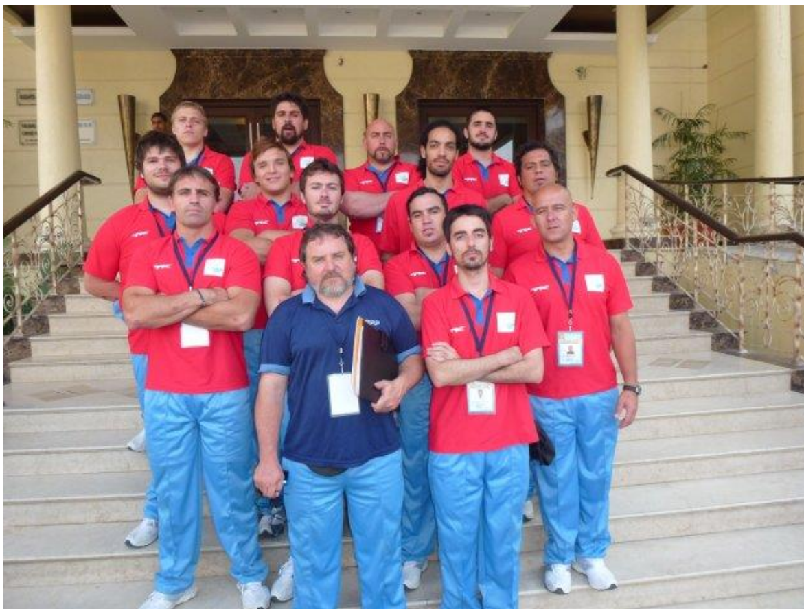
Los Chanchos, primera selección Argentina de Circle Kabaddi (Jalandhar, Punjab, India 2011)

La edición 2014 tuvo características completamente diferentes a las ediciones anteriores, los tiempos de preparación y la conformación del equipo se vio afectado por la falta de confirmación hasta último momento por parte de los organizadores, sobre todo en vista de que la Liga Mundial había tenido un gran protagonismo en la agenda deportiva del Kabaddi. Sin embargo y luego de varias idas y vueltas se volvió a confirmar la participación de los Chanchos en la 5ta World Cup Kabaddi, a realizarse nuevamente en Punjab India. Esta vez el equipo contó con la participación de seis platenses, dos chubutenses y un rionegrino.