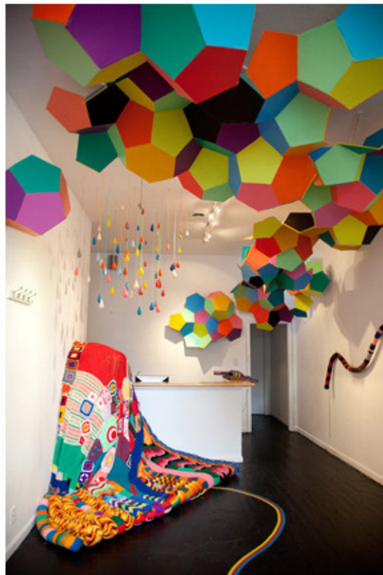
Contraste de colores