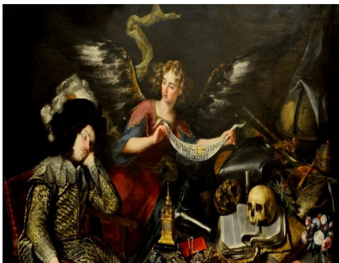
Ilustración 3 "El sueño del Caballero"

Otro ejemplo es Antonio de Pereda y Salgado es un pintor del Barroco español. Nació en Valladolid en 1611, era hijo de un pintor y tras la muerte de su padre, fue a Madrid. Realizó obras religiosas y bodegones, entre los que destacan los cuadros de vanitas .