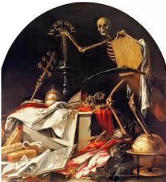
Ilustración 1 "In Ictu Oculi"

Es conocido fundamentalmente por sus dos pinturas «de jeroglífico» sobre las postrimerías humanas: las alegorías Finis gloriae mundi (El fin de las glorias mundanas) e In ictu oculi (En un abrir y cerrar de ojos). Su asunto macabro alude al tema de la vanitas (vanidad humana) y amonesta sobre la caducidad de los bienes temporales y la brevedad de la vida terrena. Vemos en sus pinturas (ilustración 1) coronas, sedas, y también mapas y espadas.