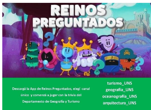
Figura 7. Reinos Preguntados

Durante todo el año se ofrecen charlas a escuelas dentro del «Programa de visitas a escuelas secundarias: la oferta académica de grado del DGyT». En esta actividad se invita a alumnos de las diferentes carreras que son el nexo entre el disertante y el alumno de escuela media y participan contando sus experiencias, repartiendo folletería o respondiendo a las inquietudes de los alumnos (Figura 8).