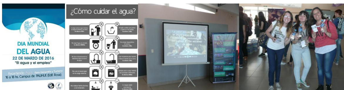
Figura 1. Día Mundial del Agua en la UNS.

Una actividad similar se organizó con la misma empresa para el 22 de abril, Día de la Tierra Madre, en esta oportunidad el lema de la ONU fue «Árboles para la Tierra», por ello se donaron árboles para el campus. El acto será el inicio de un proceso de forestación que por la cantidad (150) y variedad de especies involucradas (acacias tuscas, acacias viscos, jacarandaes, manzanos de flor, almendros, lapachos y fresnos), durará aproximadamente dos años (Figura 2).