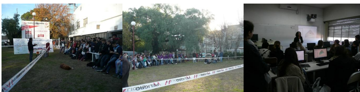
Figura 5. Actividades del Depto. de Geografía y Turismo en la Muestra Informativa de Carreras del Nivel Superior. 2015 y 2016.