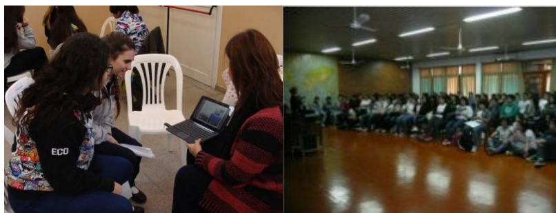
Figura 8. Programa de visitas a escuelas secundarias: la oferta académica de grado del DGyT Edición 2015/16.

Durante todo el año se ofrecen charlas a escuelas dentro del «Programa de visitas a escuelas secundarias: la oferta académica de grado del DGyT». En esta actividad se invita a alumnos de las diferentes carreras que son el nexo entre el disertante y el alumno de escuela media y participan contando sus experiencias, repartiendo folletería o respondiendo a las inquietudes de los alumnos (Figura 8).