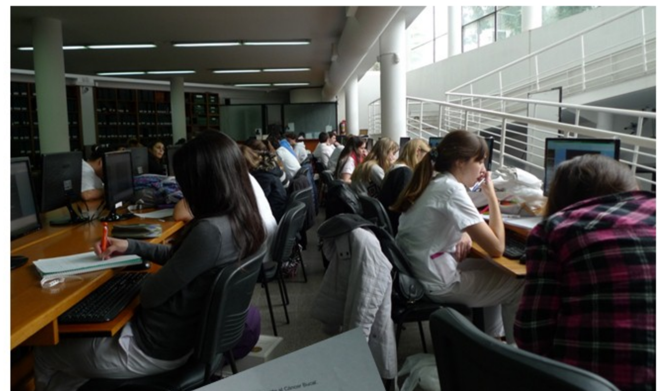
Grupo que fue tomado como Muestra para realizar el estudio