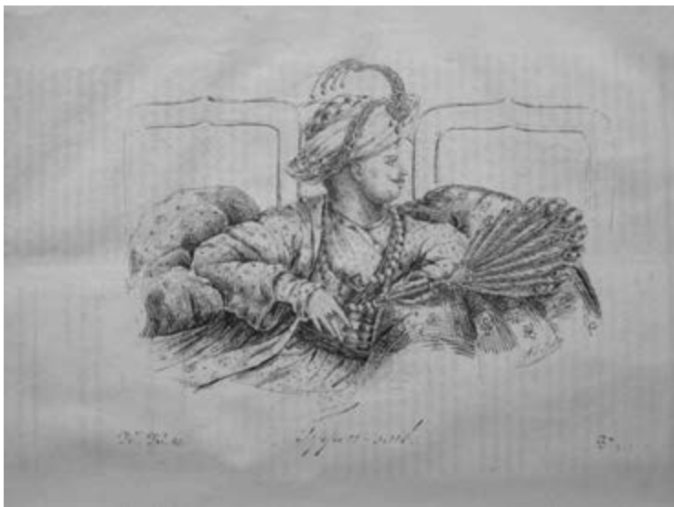
Figura 4. Tipou Saib (1835), Andrea Macaire. Litografía sobre papel.