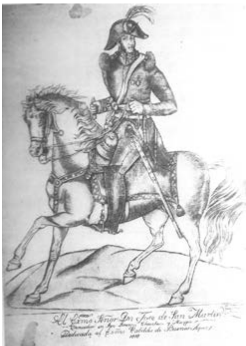
Figura 2. El General San Martín (1818), Manuel Pablo Nuñez de Ibarra Grabado sobre papel, 34 x 27,5 cm.

Lo primero que hay que reconocer es que esos objetos no responden al canon al que todos estamos acostumbrados o a la definición de obra de arte. Por ejemplo, los primeros grabados que hay de los rostros de Belgrano y de San Martín, que son los que hizo Manuel Pablo Núñez de Ibarra a principios del siglo XIX, son de baja calidad estética. Ahora bien, ¿qué relevancia cultural tuvieron esos retratos para la comunidad en la que se insertaron?, ¿por qué ese objeto es significativo históricamente? El retrato de Belgrano hecho por Manuel Pablo Núñez de Ibarra es significativo para la historia del arte local, ya que su importancia radica en que fue el primer rostro que se le dio a ese héroe nacional [Figura 2]. De ahí que uno no pueda acercarse a esa obra desde su composición o desde los principios académicos. Las pautas que sí rigen para el análisis de esos objetos son las que se vinculan a la producción y a la circulación, es decir, a quiénes lo fabricaron y por qué, quiénes lo consumían y por qué o qué importancia tuvo y tiene ese objeto particular para el campo de los estudios culturales o de la cultura visual dentro del campo artístico local.