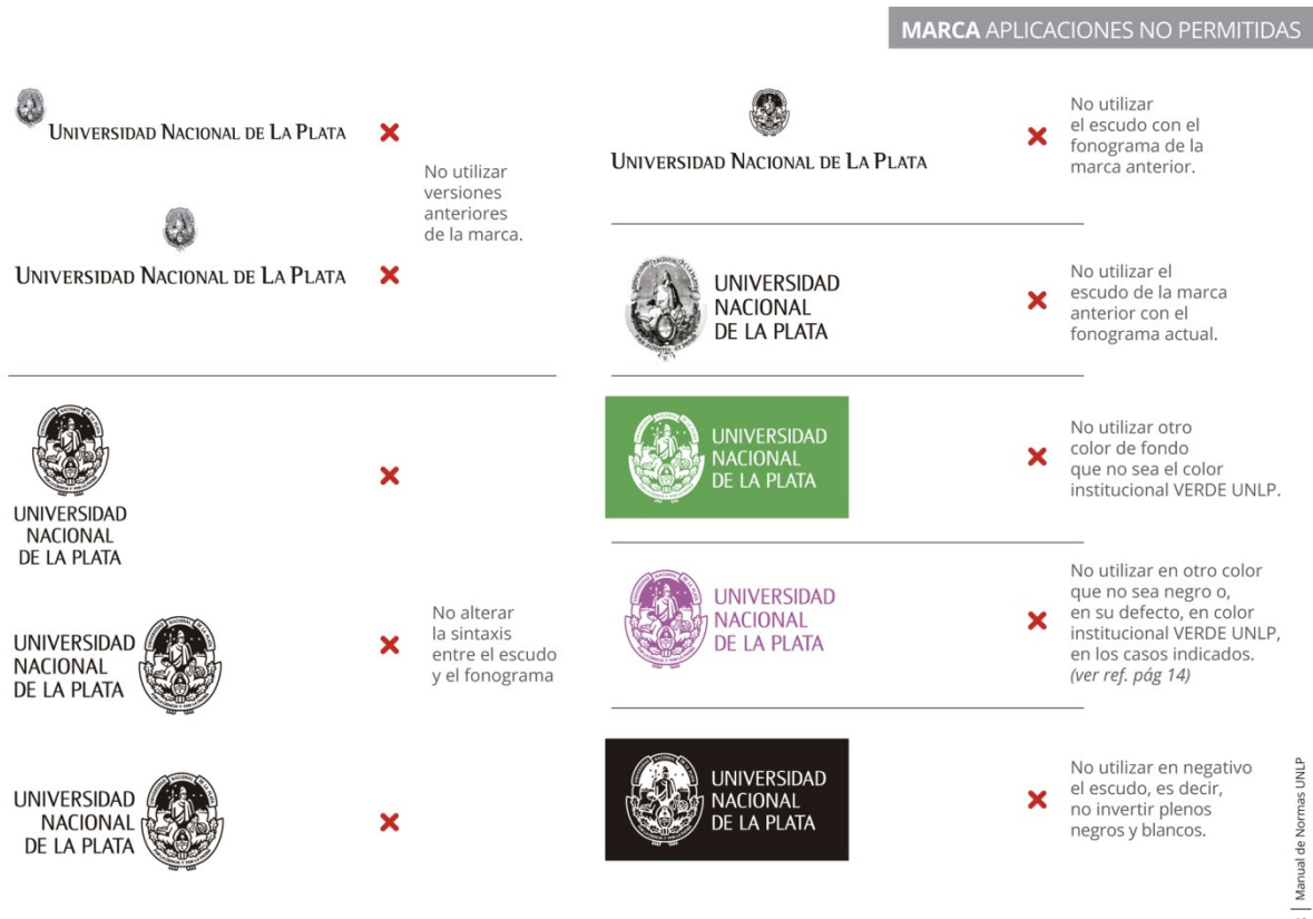
Figura 3: Algunas aplicaciones no permitidas en el Manual de Normas.