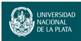
Marca con fondo pleno de color institucional