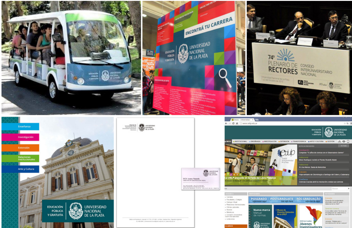
Figura 4: Implementación de la identidad visual en distintos contextos y soportes.

Finalmente, para contextos externos en los que otras instituciones aplicarán la marca, la misma tiene que poder mantener su presencia y debe soportar ser aplicada sobre fondos con texturas o con imágenes, ya que la implementación será realizada en el marco de otros criterios.