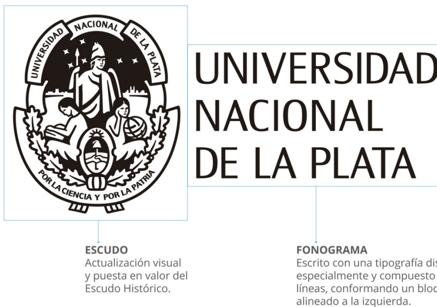
Figura 2: Nueva marca de la UNLP.

En el aspecto pragmático, el signo aporta legibilidad en tamaños mínimos, con una importante economía de recursos al permitir su reproducción a una tinta o grabado en todas las técnicas y soportes.