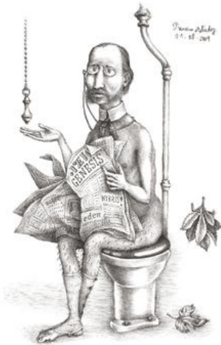
Figura 2. Ilustración de Francisco Meléndez en Twain, Mark (2010). Los diarios de Adán y Eva . Barcelona: Libros del Zorro Rojo, página 38

los contornos están dados por texturas de líneas con trazos cortos. En general, la perspectiva no se corresponde con una mirada realista ( dicente ).