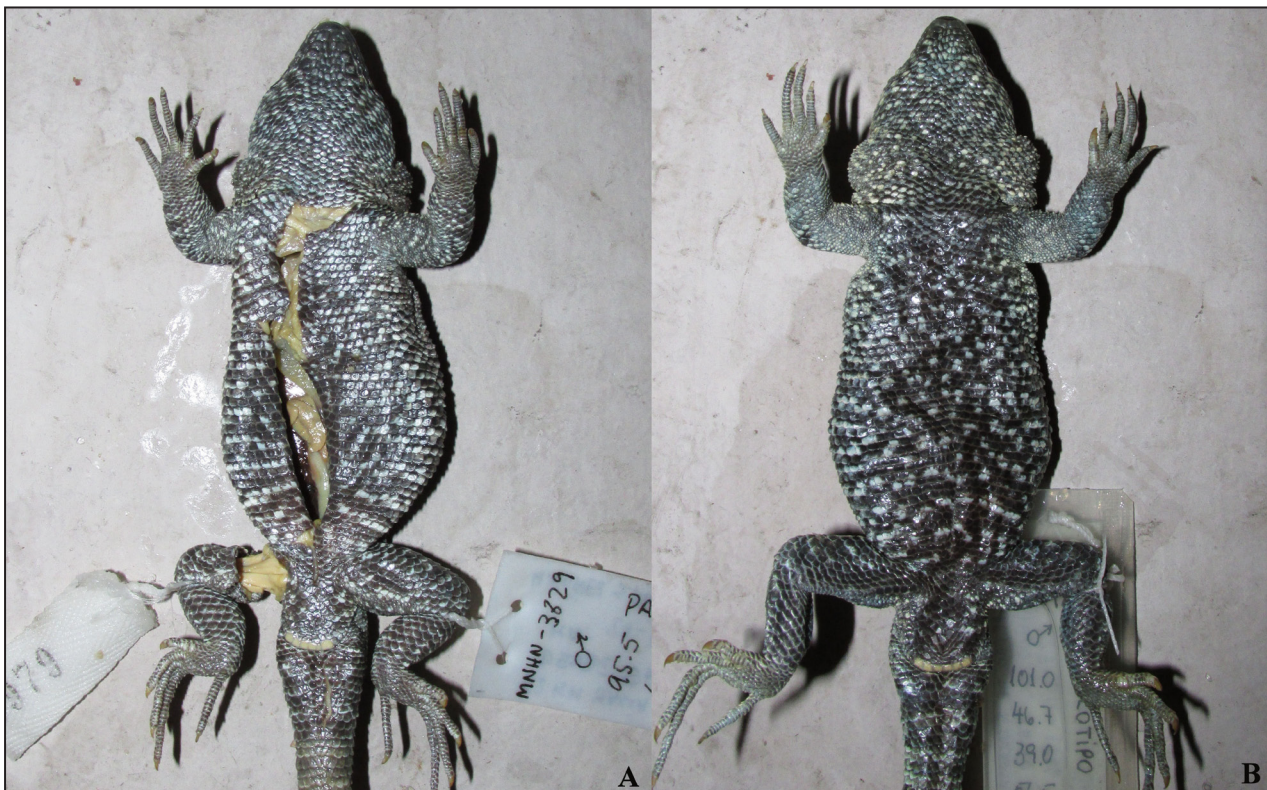
Figura 3. Comparación del diseño y color ventral. A) Holotipo de Liolaemus filiorum (MNHN-CL 3829). B) Holotipo de L. puritamensis (MNHN-CL 1880).

Dados todos los antecedentes expuestos sobre la escasa y confusa información disponible sobre Liolaemus filiorum , propongo considerar a esta especie un sinónimo menor de L. puritamensis dado que: 1) No he encontrado diferencias entre ambas especies para los caracteres de diagnóstico propuestos por Pincheira-Donoso y Ramírez (2005) ni en otros caracteres relevantes de escamación (Tabla