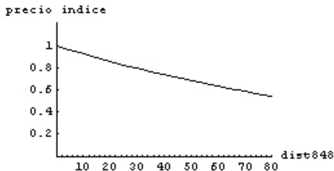
Figura 3: Relación precio distancia

En otras palabras, aquí encontramos un gradiente de renta para cada submuestra, pero permitimos que varíe entre submuestras. Nuestra hipótesis de que el gradiente disminuye con la distancia nos estaría indicando que el mayor gradiente 4 sería el de La Plata, siguiéndole el de Gonnet y luego el de City Bell.