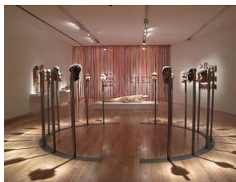
Foto.1. Emplazamiento circular de máscaras. Tekoporá.

Emplazamiento circular de las máscaras rituales (Foto 1), al simbolizar la ronda característica del baile ritual. El número de máscaras depende del tamaño de la sala de la muestra. Se evidencia una disposición distinta del objeto, permitiendo al público aproximarse íntimamente con los objetos exhibidos. En cuanto a la cantidad de máscaras, se pretende un número de 15 a 20.