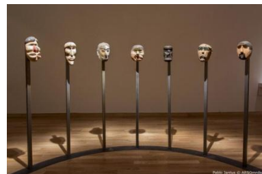
Foto 2. Presentación de las máscaras. Muestra

Es indispensable contar con el registro musical de la celebración ritual en el momento del ingreso de los espectadores al círculo de las máscaras.