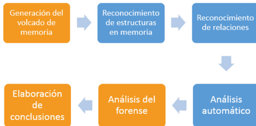
Fig. 1. Esquema reducido del proceso de análisis forense de memoria principal

En la Figura 1 se puede observar un ejemplo de esquema reducido de un procedimiento completo de análisis forense en memoria principal.