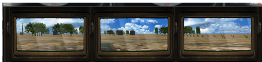
Figura 1. Visión del usuario conductor en un ejercicio del simulador NeoNahuel.

La división Computación Gráfica y Visualización 1 ha desarrollado el simulador SIMOA 2 (simulador para observadores adelantados) en sus versiones I (año 2001), II (año 2004), III (año 2013). Actualmente están instalados y en funcionamiento en el Colegio Militar de la Nación (CMN) en Palomar, en la Escuela de las Armas (EDA) en Campo de Mayo, y 11 Grupos de Artillería a lo largo todo el país. Este grupo de trabajo también desarrolló el software de la primera versión del simulador de combate para tripulaciones del tanque TAM 3 , NeoNahuel (2012) (Fig. 1), que está a la espera de la finalización de la construcción de las cabinas para proceder a su instalación.