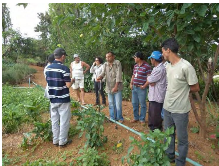
FIGURA 3. Taller de manejo y diversificación realizado en la propiedad del agricultor en Brasilia, Brasil. Embrapa Hortalizas, 2015.

Los indicadores utilizados en ese trabajo fueron la puerta de entrada para las discusiones sobre las prácticas sostenibles de producción. El grupo de agricultores es bastante diverso y va desde agricultores pequeños bastante diversos y comercialización directa hasta agricultores menos diversos y con canales de comercialización mas establecidos en las grandes plazas de comercialización. De modo general, la evaluación del suelo presentó un desequilibrio entre los componentes en todas las fincas estudiadas. Estos agricultores son convencionales en su forma de producción y ese ha sido una forma práctica de mostrar la necesidad de incremento da materia orgánica, como el uso de coberteras de suelo como los abonos verdes. En este contexto, fue presentado las ventajas de uso de los abonos verdes y sembradas algunas áreas para muestra de las especies mas indicadas para la región.