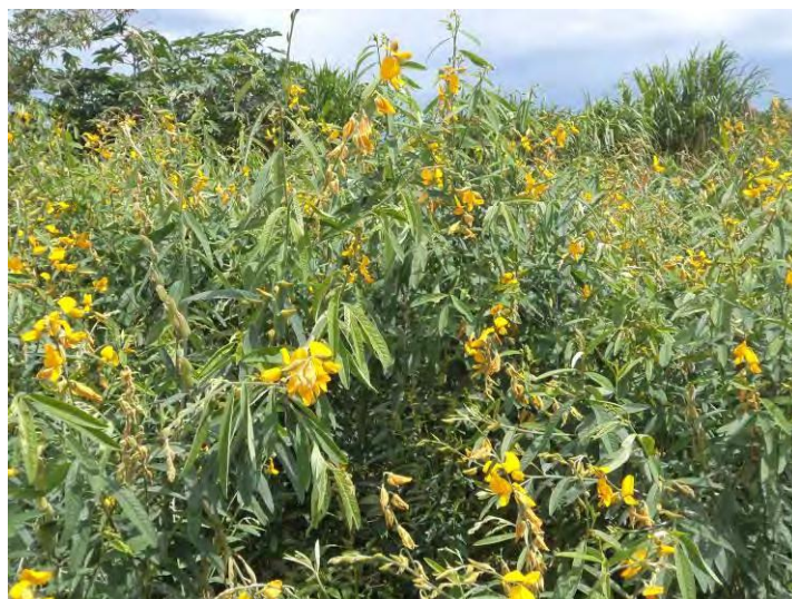
FIGURA 2. Especie de abono verde Crotalaria juncea en la propiedad del agricultor en Brasilia, Brasil. Embrapa Hortalizas, 2015.