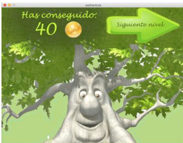
Figura 4. Ejemplo de pantalla de fin de capítulo

El método que más se adapta a este estudio es el método descriptivo, debido a que se adecua más a las actividades al ser necesario explicar y describir lo que los alumnos deben hacer. La metodología empleada para cada grupo es la siguiente: