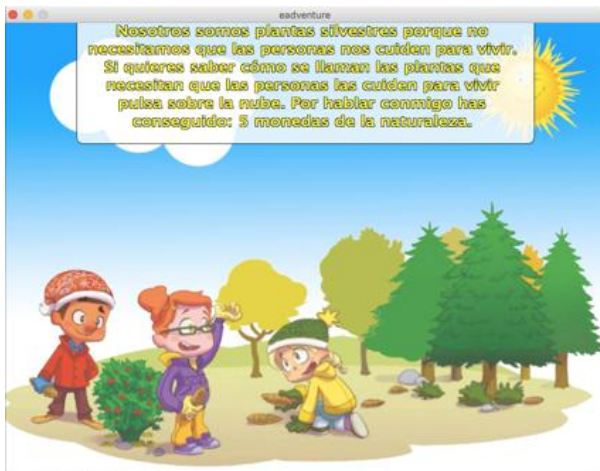
Figura 3. Ejemplo de pantalla del capítulo 3

una alumna con adaptación curricular individualizada no significativa que recibe apoyo en el aula en las materias troncales. El método de enseñanza que sigue su tutor incluye el uso de presentaciones multimedia y actividades en pizarra digital, por lo que resulta más natural introducir el videojuego en esta aula al no ser necesario adaptación a la herramienta. Este grupo se ha seleccionado como grupo experimental para trabajar con la herramienta eAdventure .