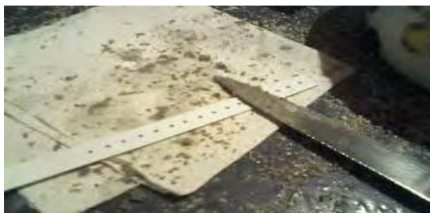
FIGURA 1. Detalle de una tira de PVC de plástico y cebo.

A los 15 días de la aplicación se procedió a la recolección de muestras de manera aleatoria, recolectando los primeros 5 cm de suelo (2 kg de suelo aproximadamente). Las muestras fueron tamizadas con un tamiz de 2 mm de abertura de malla, y defaunadas mediante freezer durante 2 días a una temperatura de -18 °C. Cada muestra se distribuyó en 4 vasos plásticos (400 gr) y se corrigió la humedad a 55 %. Se colocaron 4 lámina-cebo por vaso, al cual se le agregaron 5 lombrices ( Eisenia foetida ) de 7 meses de edad y clitelio desarrollado. Las muestras se mantuvieron a 21 °C durante 3 días para la posterior recolección de las láminas y recuento de cebos.