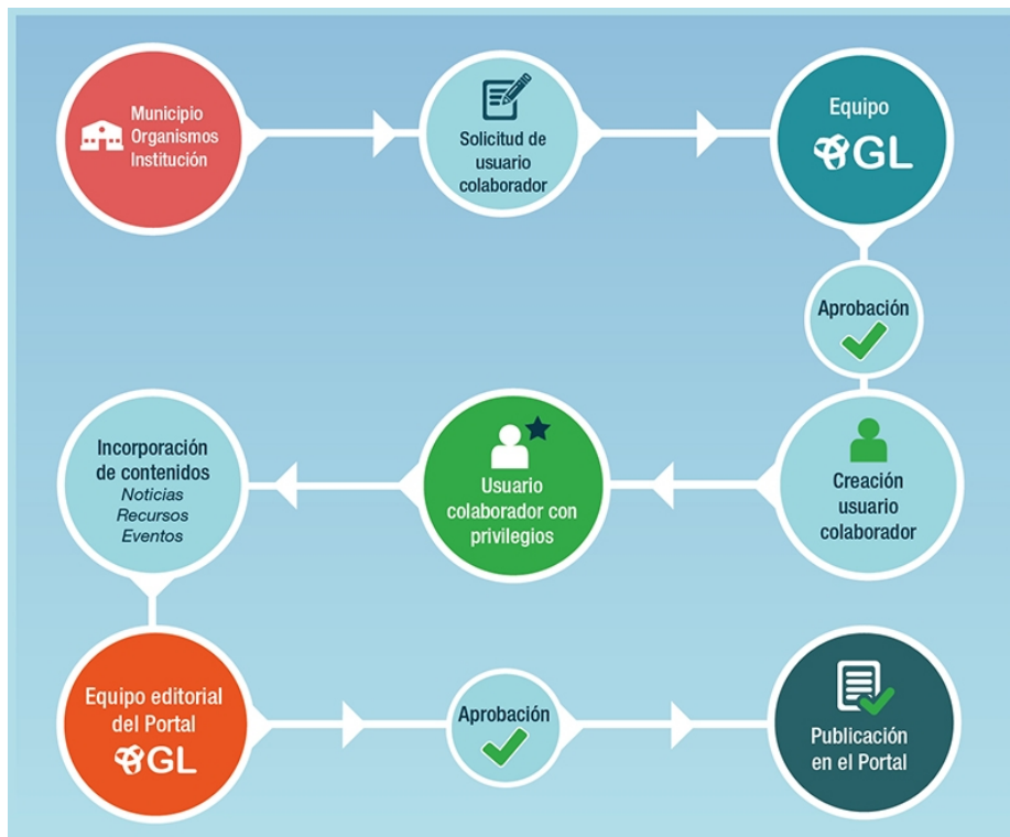
Fig. 4. Workflow de solicitud de usuario colaborador y participación en GL.

En la práctica estos Usuarios Colaboradores surgen a partir de la vinculación previa en los espacios de GL, por medio de los cuales se conoce la propuesta del portal, los mecanismos de participación, y se generan espacios de trabajo que promueven prácticas de construcción colaborativa. En particular, el espacio de los cursos virtuales es el principal ámbito de interacción.