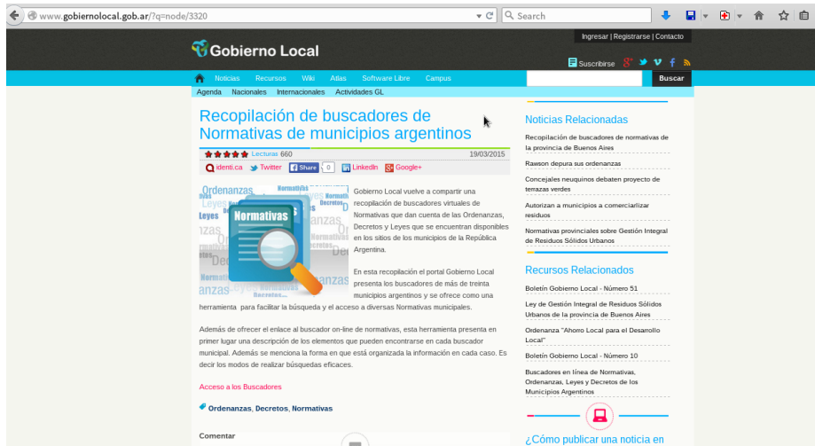
Fig. 3. Vista de un recurso en el portal GL y su información relacionada según taxonomías.

captadas por el equipo (lugares, presentaciones, imágenes originales, etc.) y cedidas por usuarios Colaboradores (ver más adelante).