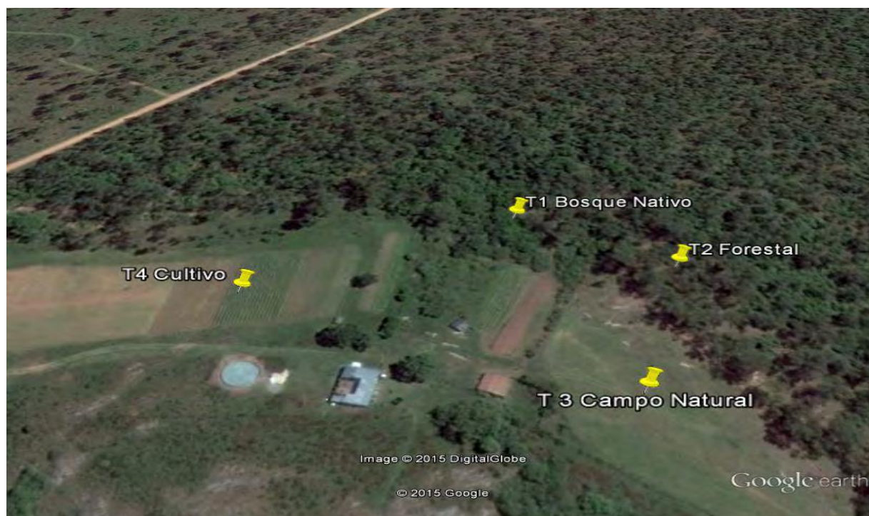
FIGURA 1. Ubicación del lugar y puntos de muestreo (Rivera, Uruguay).

El estudio se desarrolló en un predio del Instituto Nacional de Colonización en la zona rural de la ciudad de Rivera, Uruguay (Fig. 1) considerándose cuatro tratamientos de uso de suelo, Bosque Nativo, Forestal ( Eucalyptus sp.), Campo Nativo y Cultivo ( Ipomoea batatas ), donde se realizó recolección de muestras simples de suelo, a razón de una por tratamiento, georeferenciándolas para permitir su replicado, obtenidas a través de una sonda metálica (25x25x10cm).