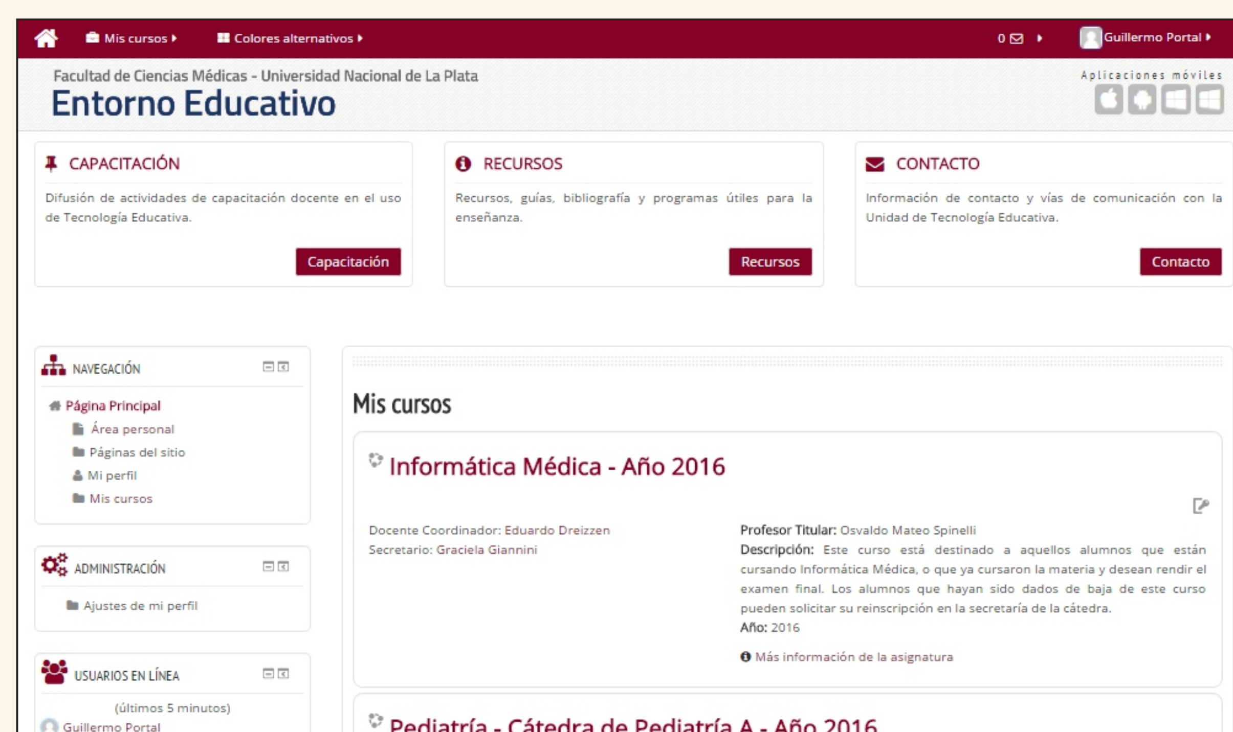
Pantalla principal de Educativa