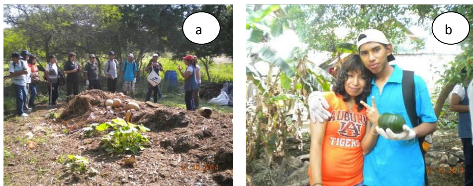
Figura 4. a) Observación de lombricario en Finca la Huella. b) Cosecha de la huerta.

Se reconoce la salida de campo como una estrategia pedagógica que favorece la enseñanza por parte del docente y el aprendizaje significativo por parte del alumno (Pérez de Sánchez y Rodríguez Pizzinato, 2006). Se seleccionó Finca La Huella (Figura 4) porque funciona en su conjunto como un sistema dinámico y sustentable.