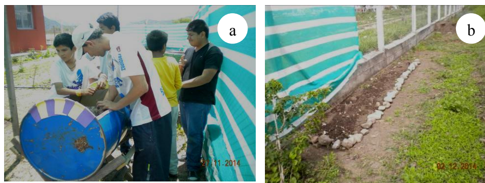
Figura 3. a) Armado de lombricario. b) Compostera organizada en patio escolar.

Se idearon en la escuela “ambientes artificiales” con elementos básicos para la conservación y reproducción de lombrices de tierra que permitió observar su acción excavadora, con la consecuencia de airear los suelos, las deyecciones, el hermafroditismo, la forma de reproducción, el desarrollo hasta el adulto y la reacción a la luz, así como también la acción de microorganismos. Las actividades (Figura 3) dado el interés mostrado por los alumnos, fueron satisfactorias, siendo fundamental el acompañamiento de docentes y estudiantes universitarios.