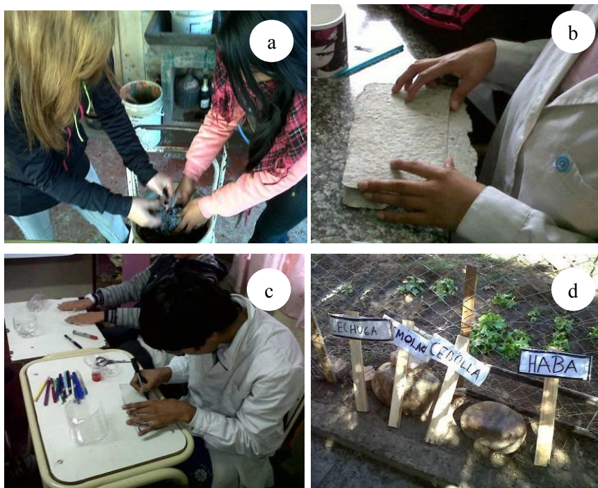
Figura 2. a) Fraccionado de papel para su reciclado; b) proceso de elaboración de una agenda; c) reciclado de botellas, cartón y madera; d) armado de carteles.

(Teberosky, 1994). El aprendizaje se centró en el reciclado y reutilización como una actividad que incluye salubridad y otros aspectos en respuesta a la propuesta educativa. Se buscó promover las mismas en los alumnos (Figura 2), favoreciendo el desarrollo de destrezas motoras y habilidades de pensamiento tendientes a beneficiar su autoconfianza.