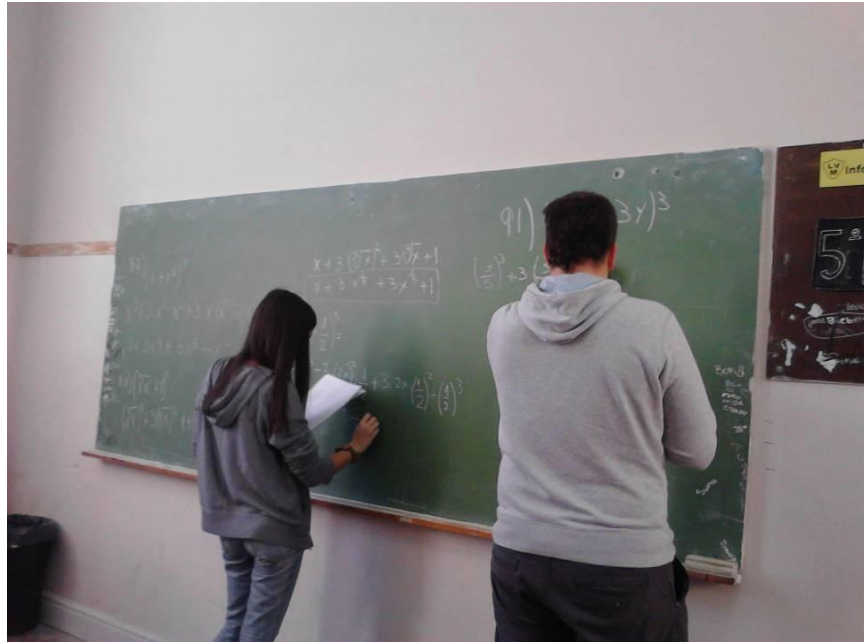
Figura 1: Evidencias de autoestima requerida para resolver problemas matemáticos

Además del cumplimiento con la tarea en tiempo y forma, han sido notorios los cambios en lo referente a: autoestima académica-social, valoración por el otro, respeto y valoración por la actividad matemática, interés por saber más (Figura 1).