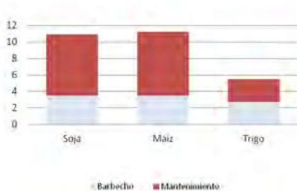
FIGURA 1. Riesgo ambiental por etapas de cultivo.

El mantenimiento del cultivo fue la etapa de mayor incidencia en el riesgo ambiental. El riesgo ambiental fue similar entre la soja, el maíz y el trigo durante el barbecho, mientras que durante el mantenimiento del cultivo fue muy superior en soja y maíz respecto del trigo (Figura 1). Una de las dificultades que se presenta en los cultivos de verano es que la época de crecimiento del cultivo coincide con la aparición y desarrollo de un gran número de especies vegetales que podrían competir con el cultivo y esto lleva al mayor uso de herbicidas. Además, los cultivos mencionados presentan resistencia a la aplicación de herbicida. La incidencia de la siembra en el riesgo ambiental fue muy baja, la cual estaba dada por los agroquímicos empleados en la curación de la semilla. Si bien algunos son de alta toxicidad las cantidades empleadas son bajas.