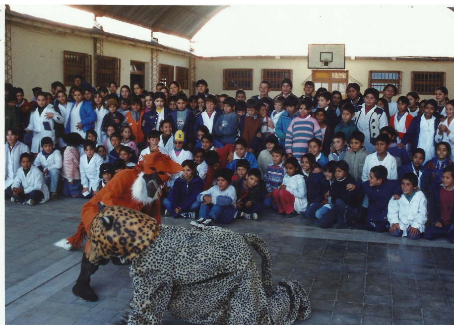
Figura 3. Breve representación a cargo de dos educadores ambientales, donde dos carnívoros, el aguará guazú y el yaguareté se re-encuentran. Charadai, Chaco.

La comunicación permanente en medios radiales favoreció en muchas comunidades, una aproximación para encuestarlos y para desarrollar diversas actividades educativas en las escuelas. Se comenzó con una etapa de sensibilización (Figura 3), registrando las respuestas y las estrategias que tuvieron buena acogida por los alumnos (Soler et al. , 2003; Soler, 2010).