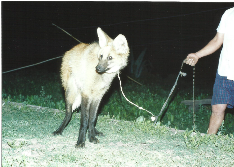
Figura 2. Aguará guazú ( Chrysocyon brachyurus ) en la casa de un poblador de Chaco. Este carnívoro se encuentra en grave situación de conservación y está prohibida su tenencia como mascota.

La comunicación permanente en medios radiales favoreció en muchas comunidades, una aproximación para encuestarlos y para desarrollar diversas actividades educativas en las escuelas. Se comenzó con una etapa de sensibilización (Figura 3), registrando las respuestas y las estrategias que tuvieron buena acogida por los alumnos (Soler et al. , 2003; Soler, 2010).