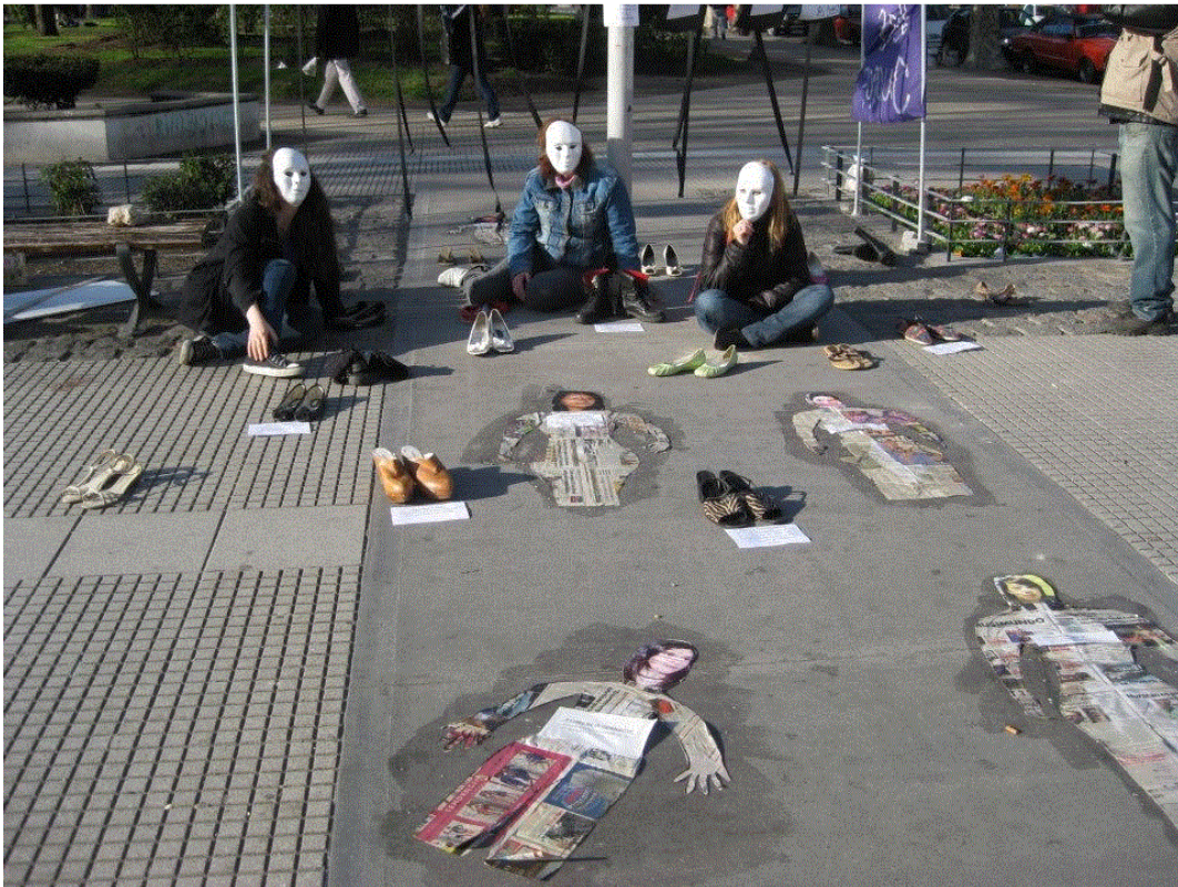
Las Juana en Mumalá. “Las estamos buscando, las queremos con vida!”.

aclaman por la “aparición con vida” de las miles de mujeres desaparecidas a causa de la trata? Manifestaciones públicas y artísticas como la emulación de un centro clandestino de detención en el que yacen mujeres prisioneras de la trata de personas, la pegatina de siluetas con los rostros y los nombres de mujeres desaparecidas por la trata, la exposición en la vía pública de pares de zapatos acompañados de fotografías pertenecientes a mujeres asesinadas a causa de la violencia de género y la presencia de mujeres manifestando en las calles portando una máscara blanca y demandando justicia para que mediante la legalización del aborto miles de mujeres dejasen de morir en el silencio y la clandestinidad; demuestran la forma en que el legado político de estas manifestaciones artísticas surgidas en tiempos de dictadura y resignificadas luego en tiempos de democracia perduran aún en el presente, son reapropiadas, se constituyen en un dispositivo simbólico y político de lucha: