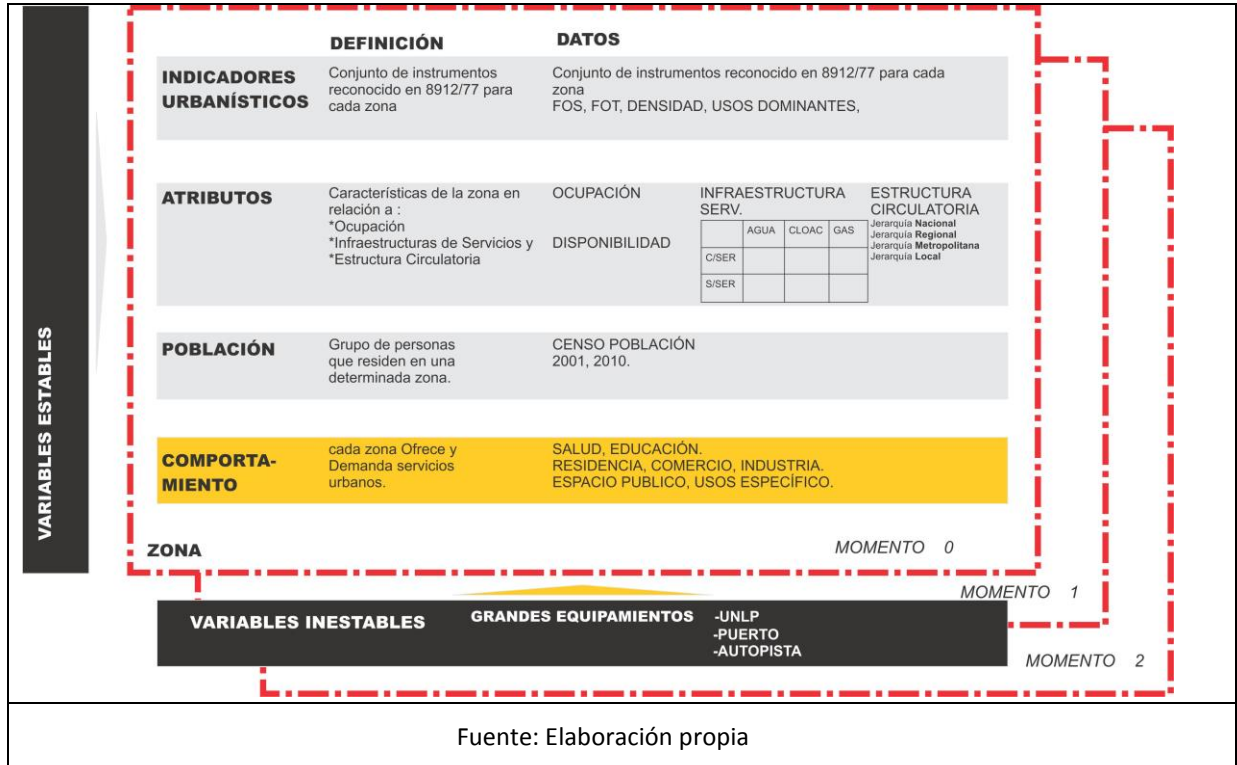
Figura 2. Esquema del Modelo

TIPO DE USO DEL SUELO: En cada zona, se permitirán todos los usos que sean compatibles entre sí. Aquellos considerados molestos nocivos o peligrosos serán localizados en distritos especiales.